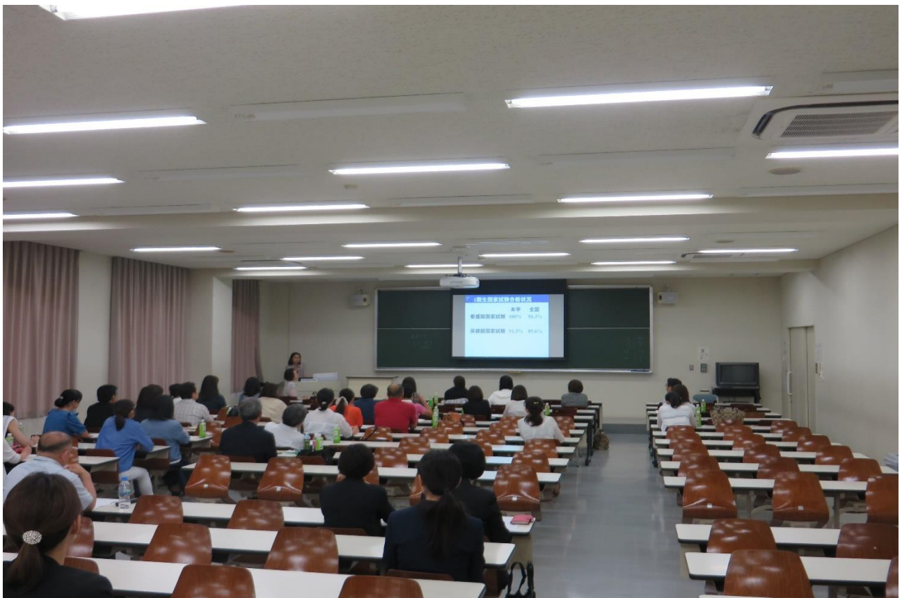
《学科別就職説明会の様子(看護学科)》