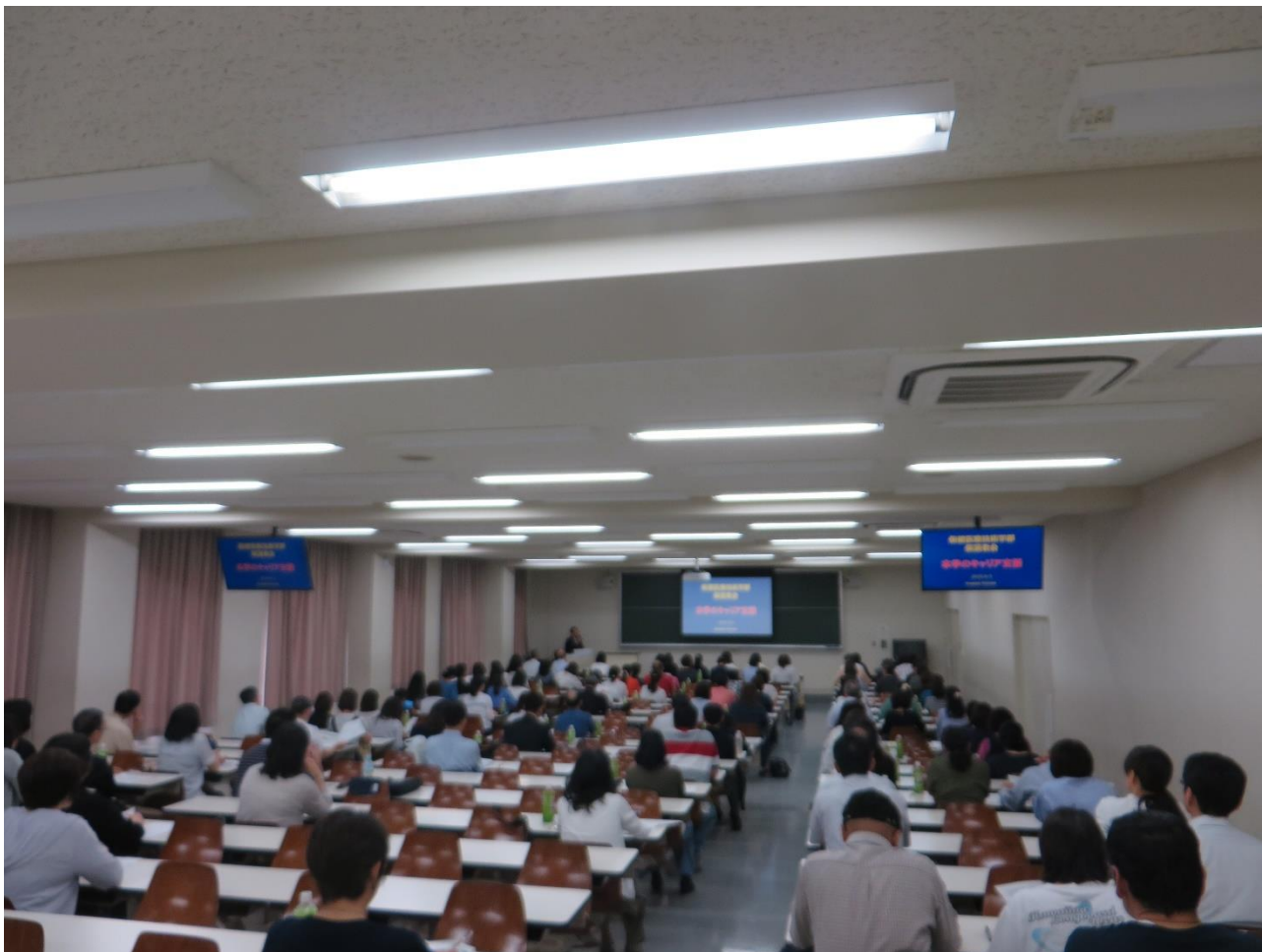
《就職説明会全体の様子》