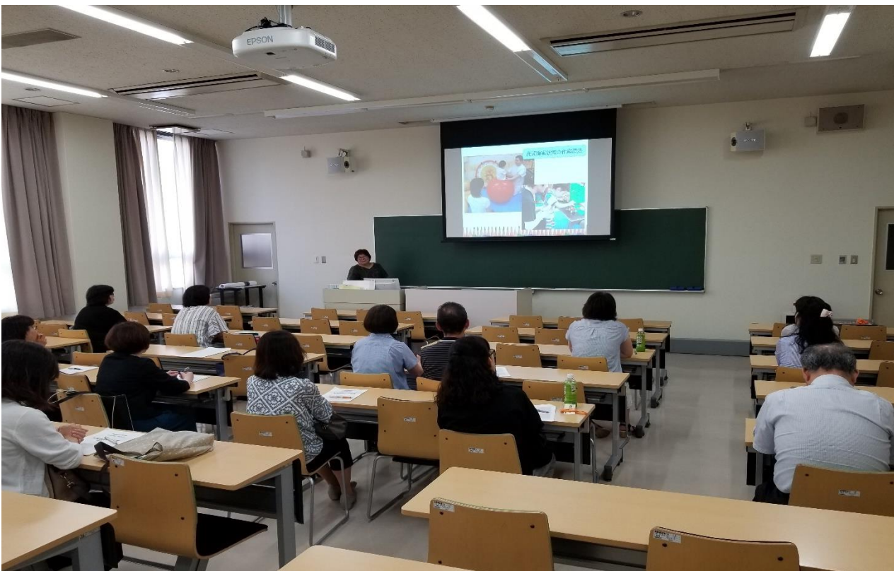
《学科別就職説明会の様子(作業療法学科)》