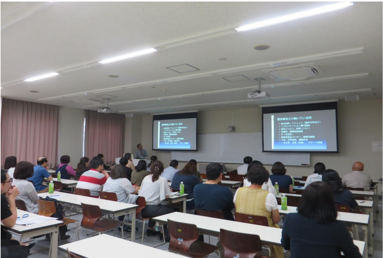
《学科別就職説明会の様子(理学療法学科)》