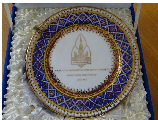
コンケン大学から届いた飾り皿