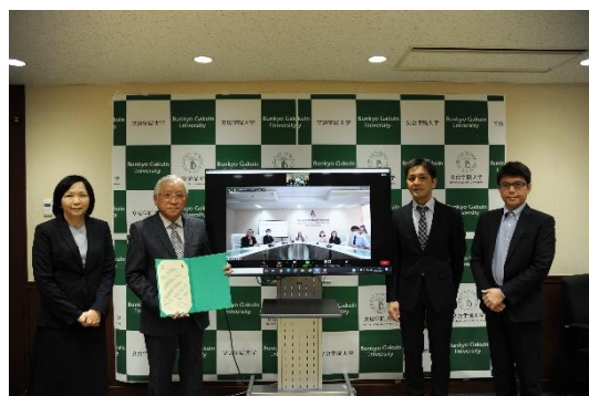
オンライン協定締結式