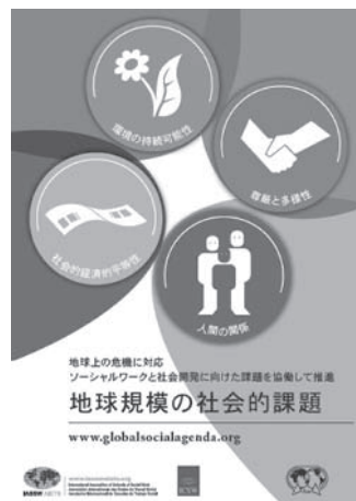
写真4 スライド 16（一部）