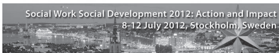
写真5 スライド23(一部)

日本のソーシャルワーク団体では、日本のソーシャルワークの日を別の日程に設定しているようですね。日付は重要ですから、それは当然のことです。ですが、もし3月20日に何か考えていらっしゃったら、ぜひ世界中で行われる他の世界ソーシャルワーカー・デーに参加してください。そして、スライドをご覧ください。もうひとつ、最新のソーシャルワークと社会開発に焦点を当てた示唆にあふれる会議がストックホルムで2012年7月8日から12日まで開催されます。興味を持って参加しようと思った人もいるのではないのでしょうか。今回は「アジェンダ：活動とその影響」に特に重点を置いています。(写真5)