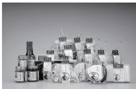
図表4 「越中富山幸のこわけ」統一パッケージ

奄美の場合、商品構成は、黒糖とその関連商品で一群を形成できそうだ。サトウキビや黒糖それ自体をはじめとして、黒糖焼酎、デザートソース、フルーツソース、ジャム、ドレッシング、パウダー、うじる(キビ汁)ゼリー等、様々な候補が考えられる。今一つの群は、黒糖以外の食品の組み合わせでつくりたい。鶏飯、パパイヤの漬物、島らっきょう、よもぎもち、蘇鉄、ツワブキ、塩、喜界島のごま等の奄美独自の食品である。価格面でも様々な工夫ができる。