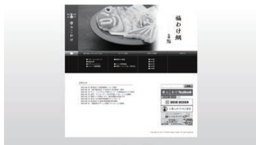
図表3 「越中富山幸のこわけ」HP

実はこの案には、富山県の「越中富山幸のこわけ」プロジェクトという優れた先例がある。富山では、婚礼の引き出物に大きな「鯛の細工かまぼこ」が長く用いられている。持ち帰られた鯛のかまぼこを切り分けて近所に「おすそわけ」し、贈る人、もらう人、そして家族や地域全体でよろこびや幸せを分かち合うという伝統である。「越中富山 幸のこわけ」ブランドは、この「おすそわけ」の文化を活かし、富山独自の食文化や、職人の技に育まれる幸の数々をお届けするために開発された。県の総合デザインセンターの主導のもと、平成21年4月に始動。女性プロジェクトチームが編成され、富山女性の視点とデザインを活用した富山土産の統一ブランド化事業として進められた。平成23年2月に記者発表。平成26年現在、23企業・26商品でブランド展開されている (12) 。